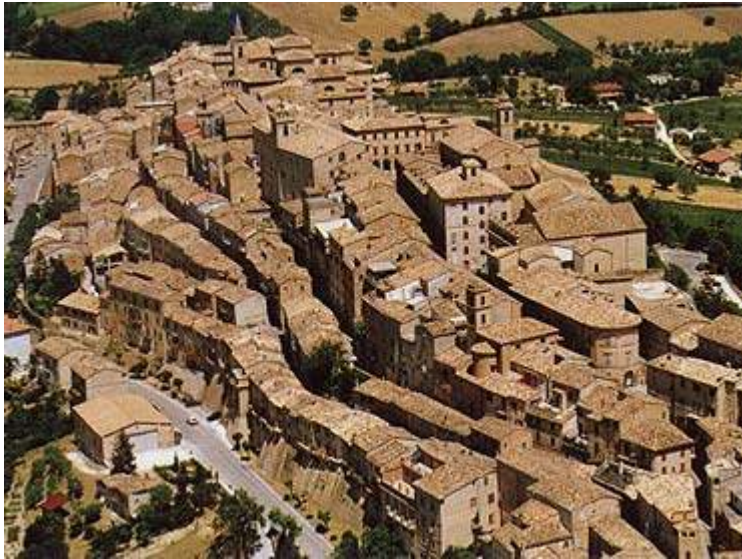
Treia : visione aerea