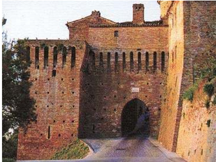
Treia : Porta Vallesacco