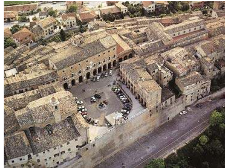
Treia : piazza della Repubblica vista aerea