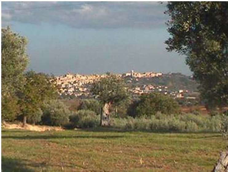
Treia : vista dalle campagne circostanti