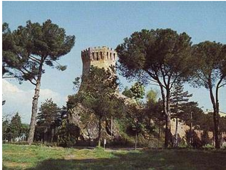
Treia : torre di S. Marco