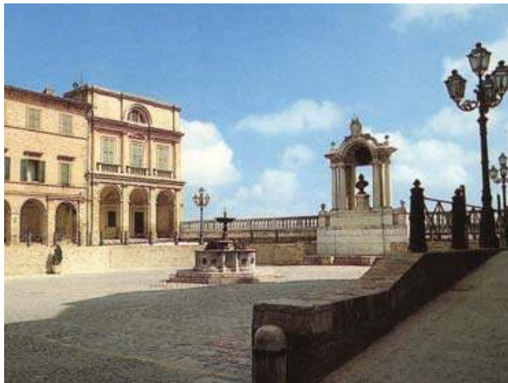
Treia : Accademia Georgica del Valadier