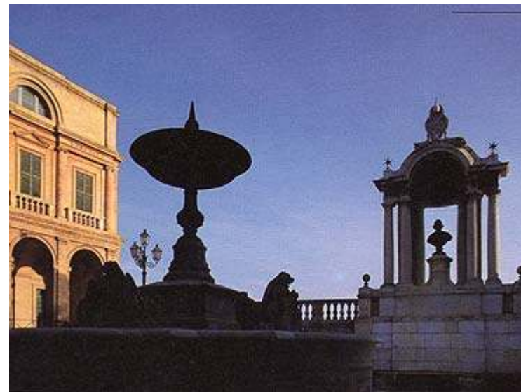
Treia : piazza della Repubblica