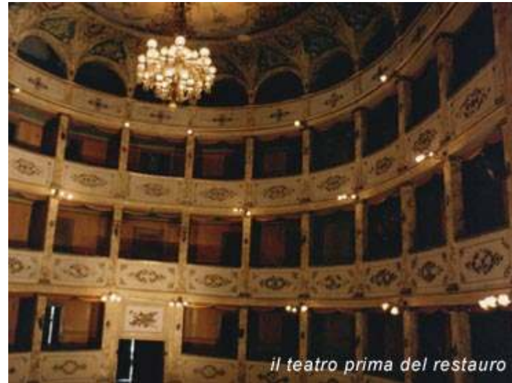
Treia : teatro comunale