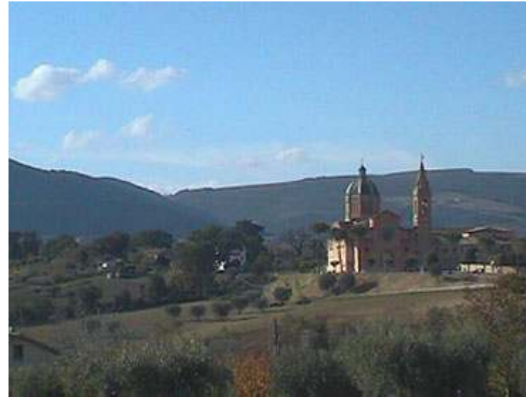
Treia : Chiesa del S.S. Crocifisso