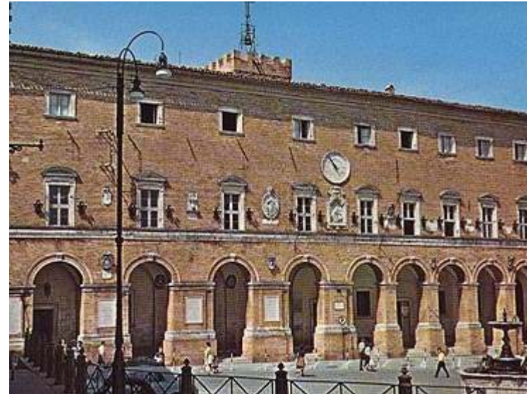
Treia : Palazzo comunale